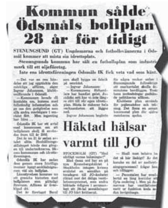
URKLIPP. Artikel från GT publicerad 10/10 1975.