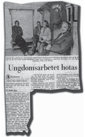
URKLIPP. Artikel från G-P publicerad 1975.

Detta fick kommunen att agera på allvar och man fick snabbt fram en ny lösning och planerna på Ödsmåls Idrottsplats i Bergsområdet kunde ta sin början. En händelse som fick stort utrymme i pressen och alla var på Ödsmåls sida som bara stred för att få sin fotbollsplan tillbaka. Man skyllde på att man inte hade några pengar att bygga en ny plan, trots att man