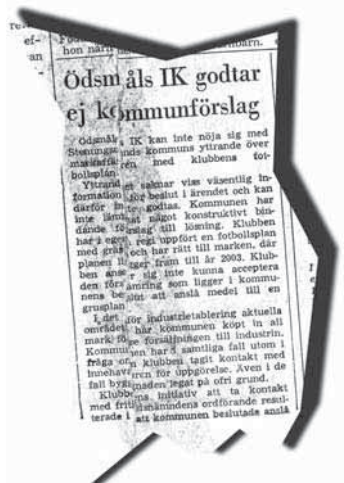
URKLIPP. Artikel från G-P publicerad 1975.

Han syftar på det som hände efter byggandet av den nya planen i Berg.