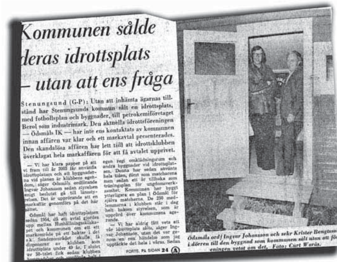
URKLIPP. Artikel från G-P publicerad under 1975.

– Jag gick en hel semester och grejade med grusplanen, eftersom jag var