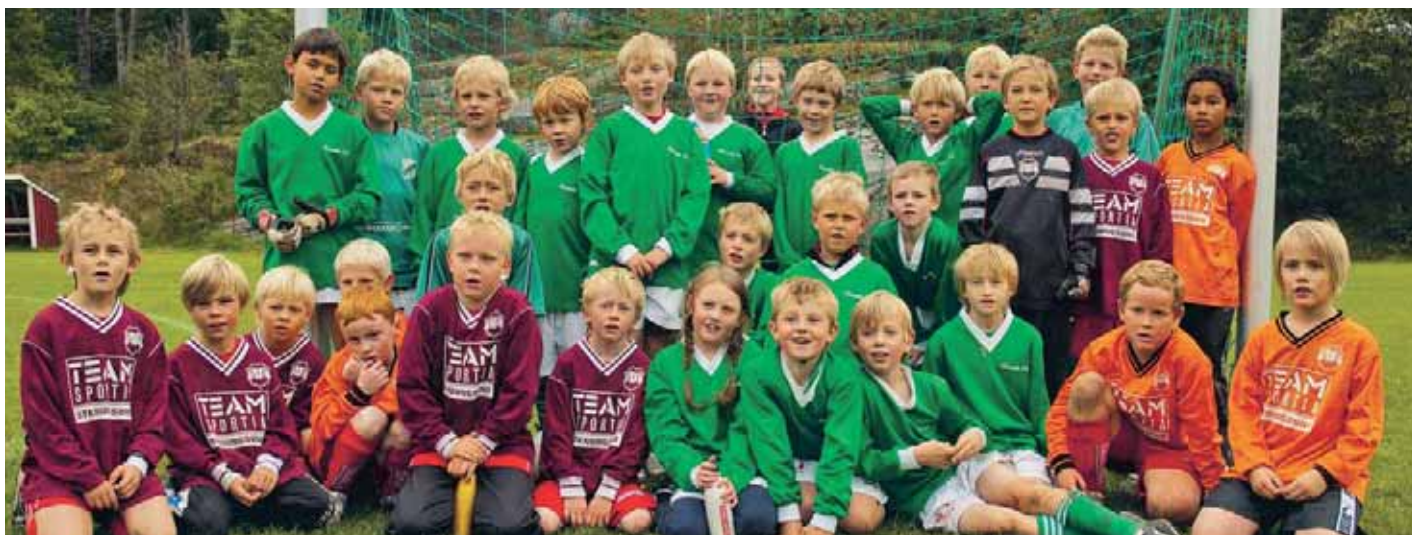
VÄNNER. Före, under och efter match är vi alla vänner och alla som vill ska få vara med och ha roligt. Både domare och motståndare.