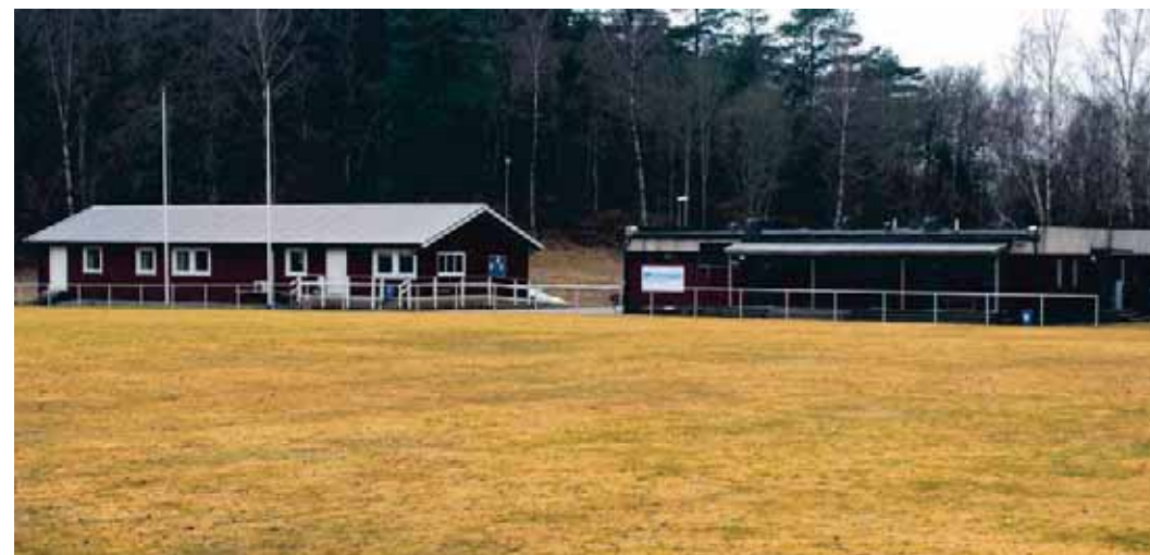
NYA KLUBBHuset. Gräsplanen, nya klubbhuset (ÖIK-gården) omklädningsrummen på Ödsmåls Idrottsplats.