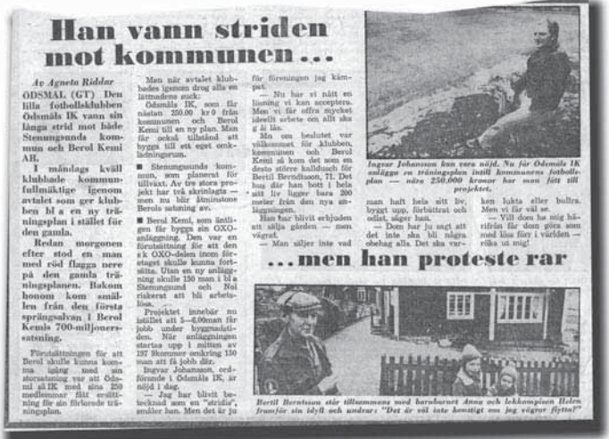
URKLIPP. Artikel från GT, publicerad 1975.

Det finns många andra som borde nämnas som på ett eller annat sätt gjort massor för klubben genom åren, både från början